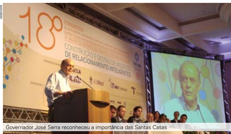
Governador José Serra reconheceu a importância das Santas Casas

Mesmo diante da eminência de assuntos polêmicos e críticos, com a lei antifumo e a confirmação de dois casos da gripe suína em São Paulo, o Governador do Estado fez questão de marcar sua tradicional presença no encerramento do Congresso da Fehosp.